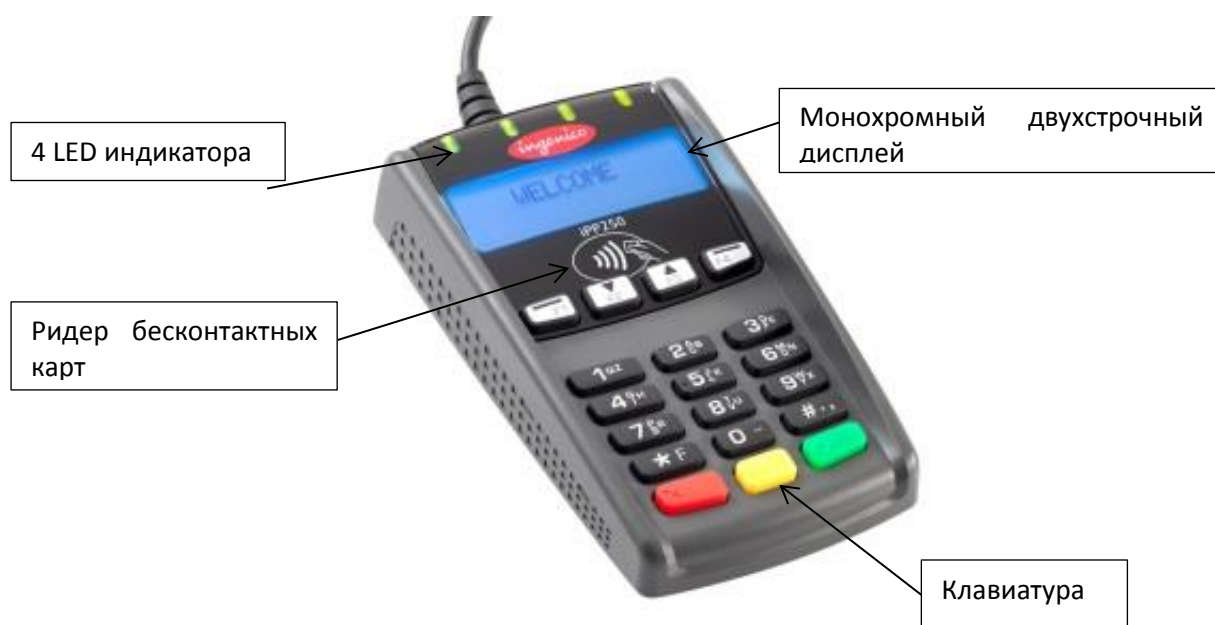
Рис. 1 Пин-пад iPP 250