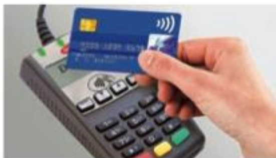
Рис.4 Чтение бесконтактной карты