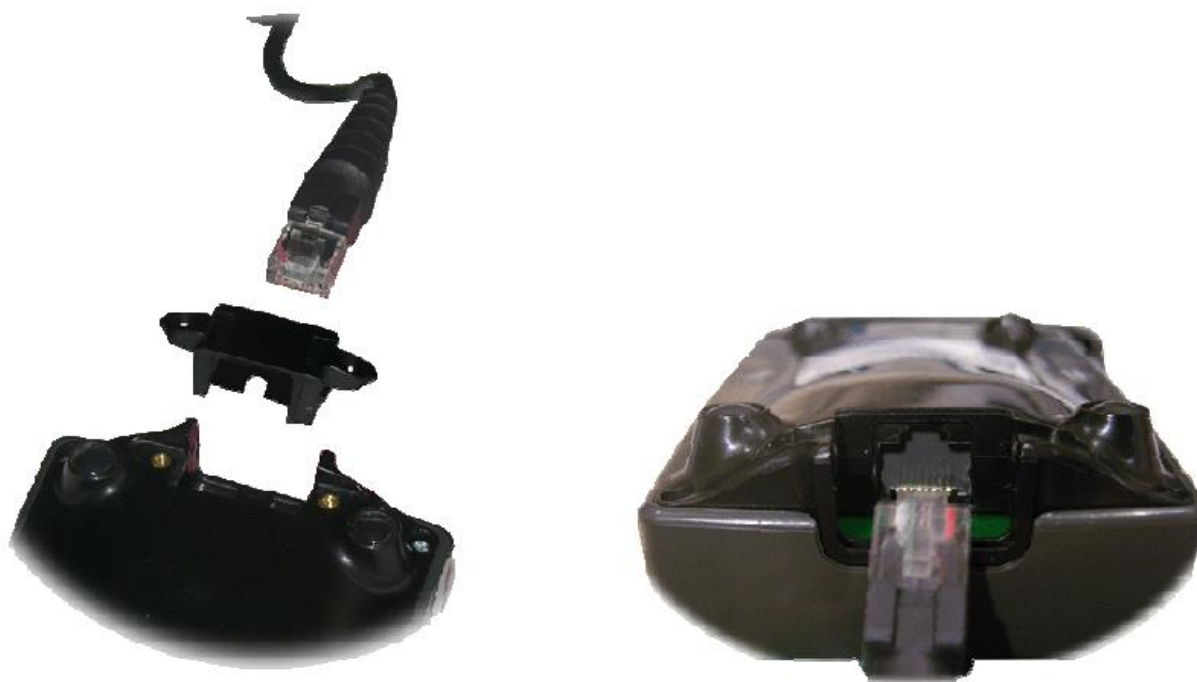
Рис. 2 Разъем терминала iSC250

Пин-пады iPP220/280 оборудованы USB проводом для подключения к терминалу. Гнездо для подключения расположено в задней части пин-пада и защищено крышкой.