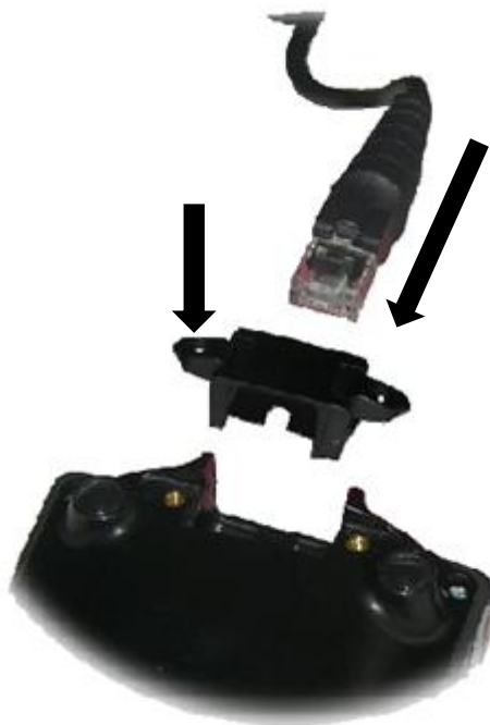
Рис. 3 Подключение кабеля к пин-паду

Подсоедините кабель к пинпаду, закройте коннектор крышкой: